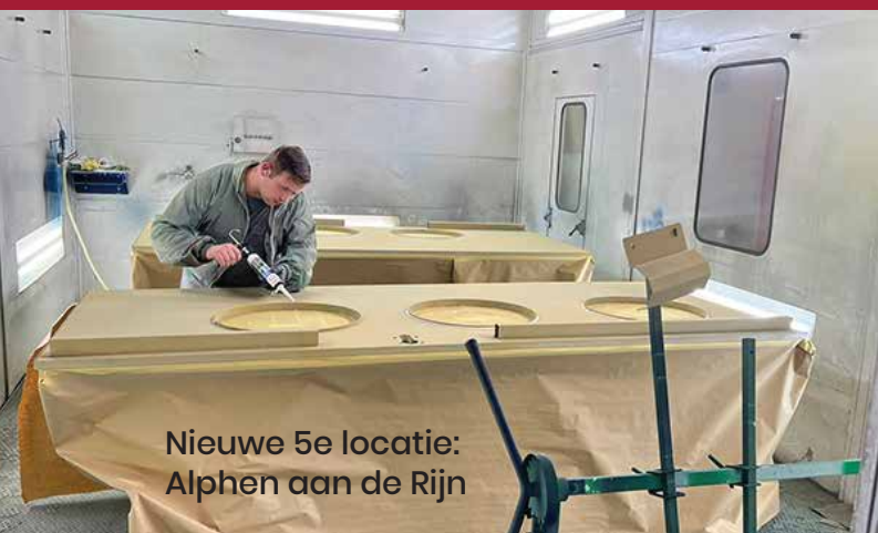
Nieuwe 5e locatie: Alphen aan de Rijn